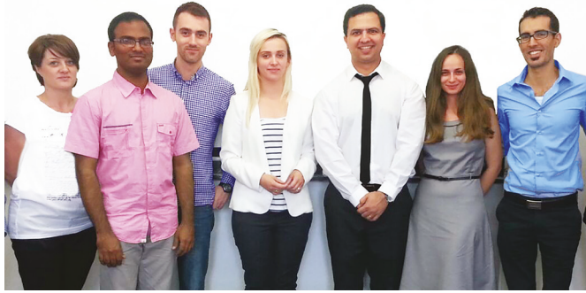
Absolventen 2016 des Kommunikationskurses für Ärzte